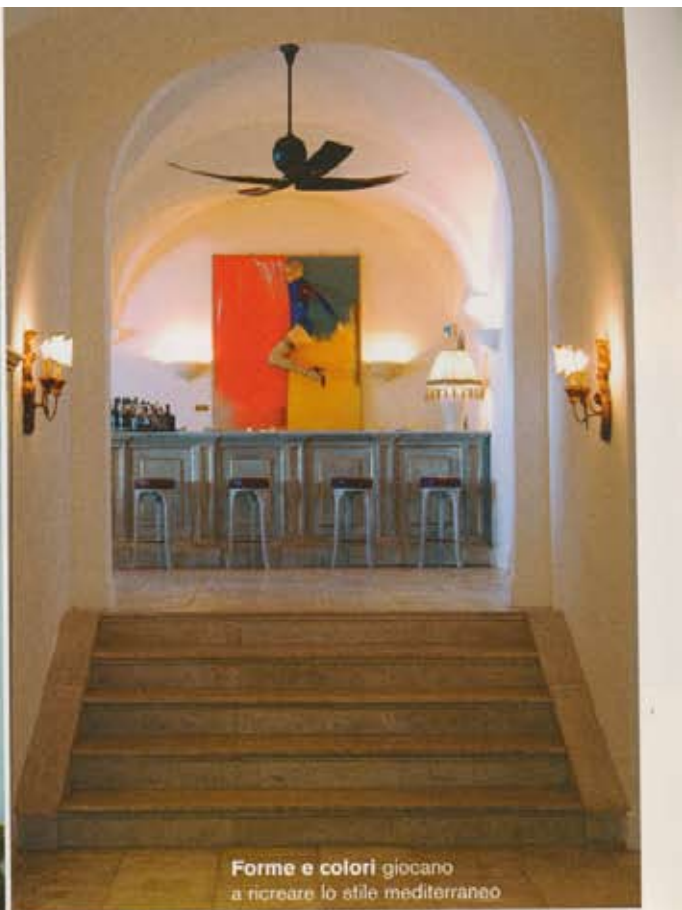
Forme e colori giocano a ricreare lo stile mediterraneo