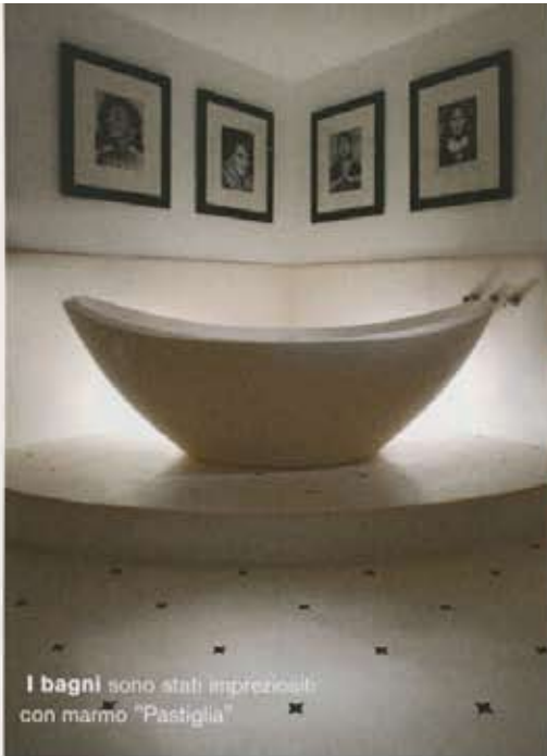
I bagni sono stati impreziositi con marmo "Pastiglia"