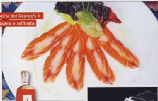
La cucina del George's è leggera e raffinata