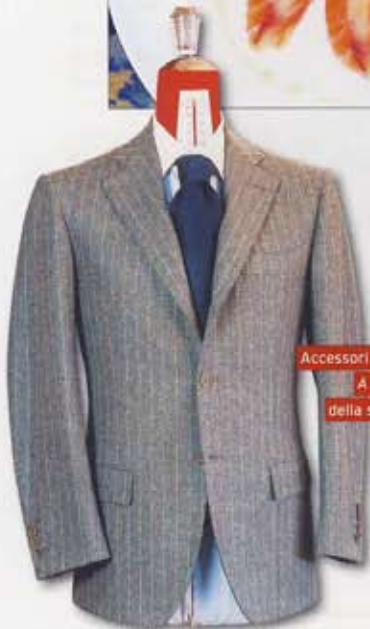
Accessori di design by Delta-Marklaro