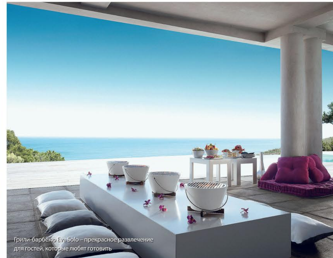
Гриль-барбекю Eva Solo – прекрасное развлечение для гостей, которые любят готовить

Если на территории есть возможность наблюдать линию горизонта не следует отгораживаться от мира толстым забором – сегодня это большая редкость, которая со временем будет цениться все больше