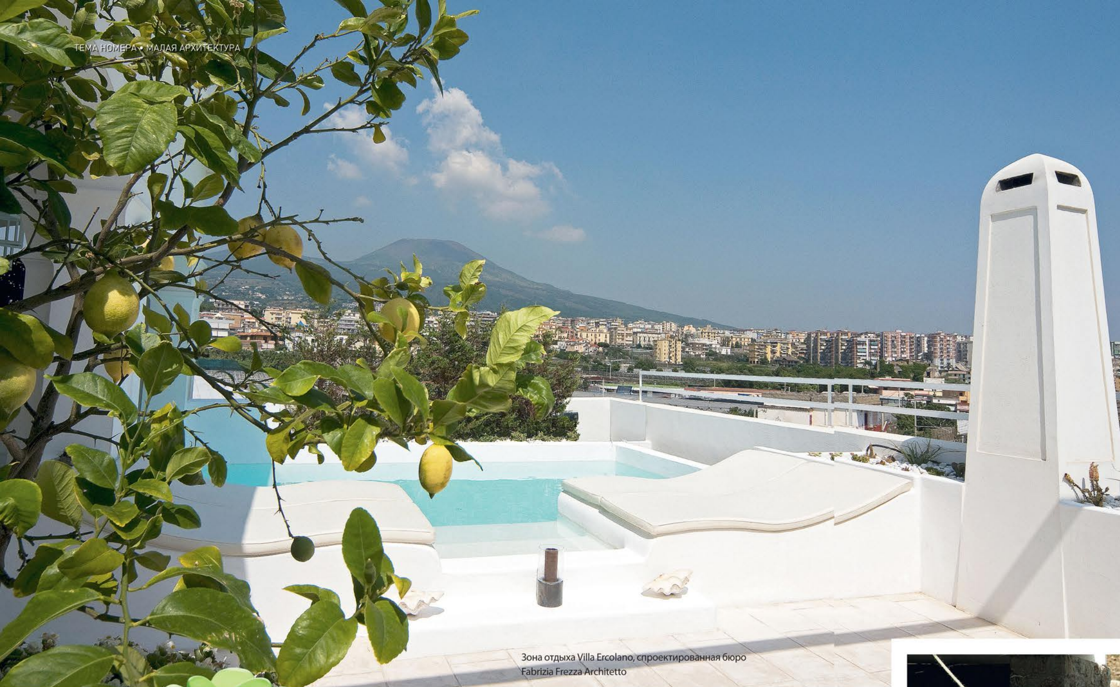
Зона отдыха Villa Ercolano, спроектированная бюро Fabrizia Frezza Architetto